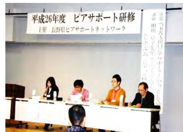
シンポジストの皆さん

最後に「これまで当事者・支援者・家族と一緒に意見交換をしたことがなかった。こういう場がとても大切だと気づいた。」とのお声があり、この会を企画した甲斐があったと大変嬉しく思いました。6時間にわたる長丁場の研修でしたが、終了後清々しい思いに心が満たされ、思い出深い一日となりました。今後こうした学びの場を大切にしていきたいと思えます。